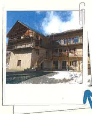
Le chalet de Molines !

Le FSED (Foyer Socio-Educatif du lycée Doisneau) est une association gérée par les adultes du lycée. Fondé en 1963, le FSED est le seul en France à posséder un chalet : chaque année, plus de 400 élèves passent une semaine à Molines, depuis plus de 50 ans ! L'association aide aussi tous les élèves boursiers du lycée sur l'ensemble des voyages scolaires et accorde des aides exceptionnelles aux élèves en difficulté financière, même non boursiers. Elle participe enfin à certains projets comme les actions de la MDL ou les comédies musicales.