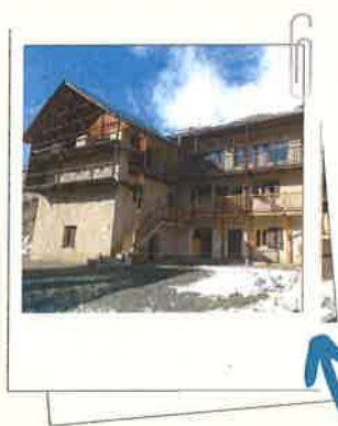
Le chalet de Molines !

Le FSED (Foyer Socio-Educatif du lycée Doisneau) est une association gérée par les adultes du lycée. Fondé en 1963, le FSED est le seul en France à posséder un chalet : chaque année, plus de 400 élèves passent une semaine à Molines, depuis plus de 50 ans ! L'association aide aussi tous les élèves boursiers du lycée sur l'ensemble des voyages scolaires et accorde des aides exceptionnelles aux élèves en difficulté financière, même non boursiers. Elle participe enfin à certains projets comme les actions de la MDL ou les comédies musicales.