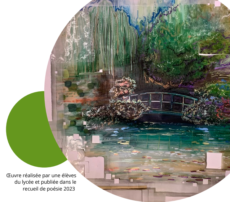
Œuvre réalisée par une élève du lycée et publiée dans le recueil de poésie 2023