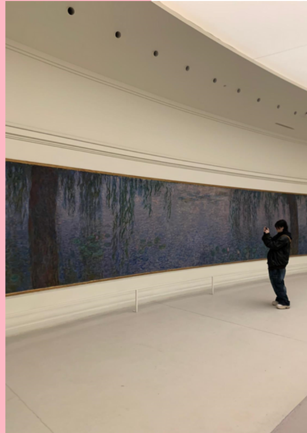
Musée de l'Orangerie

Le musée de l'Orangerie expose également les artistes Marie Laurencin, Picasso ou encore Modigliani. Vous pouvez (re)découvrir les œuvres de Philippe Cognée jusqu'au 04 septembre 2023 et les cahiers d'art de Matisse jusqu'au 29 mai 2023.