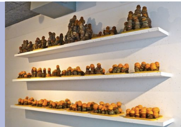
Bar à oranges, Michel Blazy, 2009, sculpture-installation, exposition « Le Grand Restaurant » au Plateau, Paris