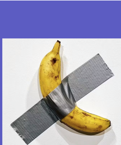
Maurizio Cattelan, Comedian, Galerie Perrotin, Art Basel Miami Beach, 2019