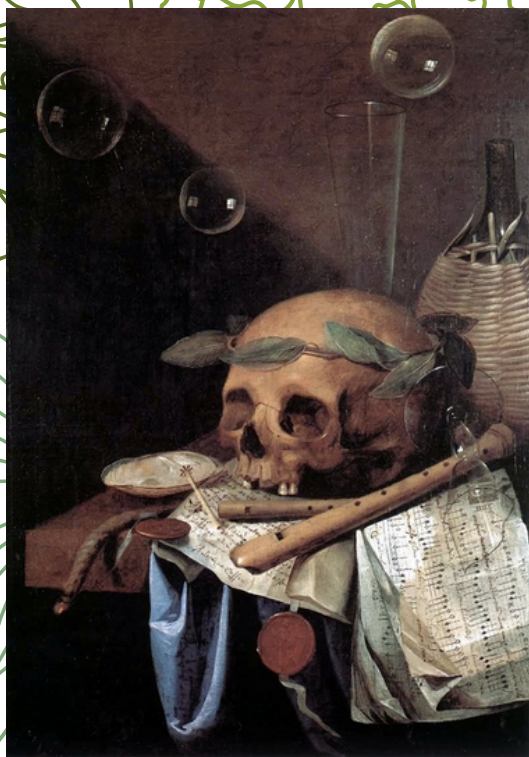
Simon Renard de Saint André, Vanité , 1650, huile sur toile, 60 x 43 cm, musée des Beaux-Arts de Lyon

Réponse : crâne, bulles de savon, notes sur les partitions de musique